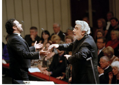
RAMON VARGAS, PLACIDO DOMINGO